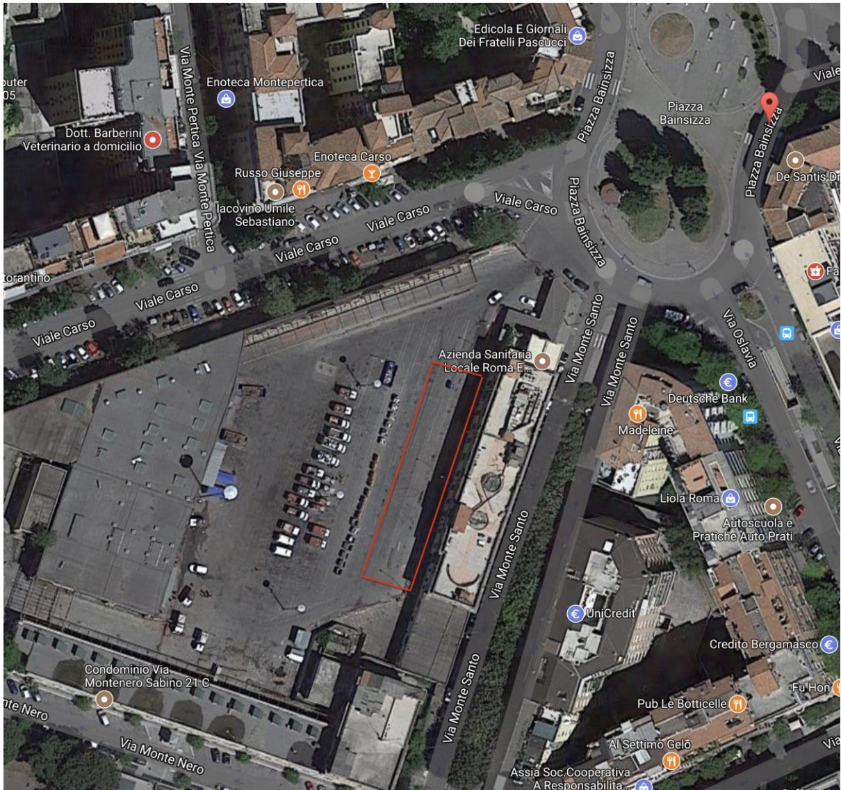
- Piazza Bainsizza