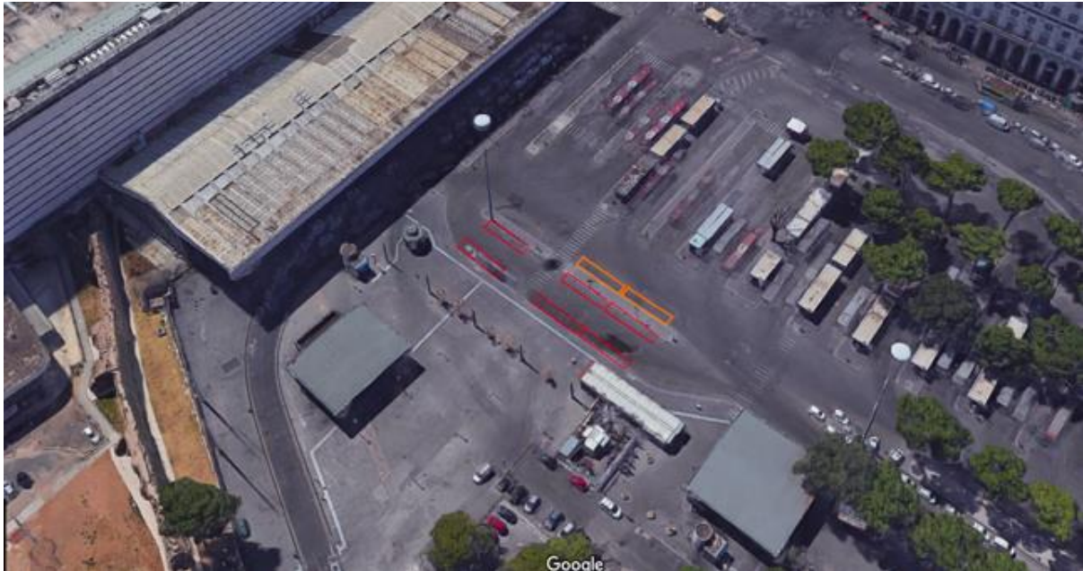
- Stazione Termini

In Rosso sono evidenziati potenziali stalli suggeriti